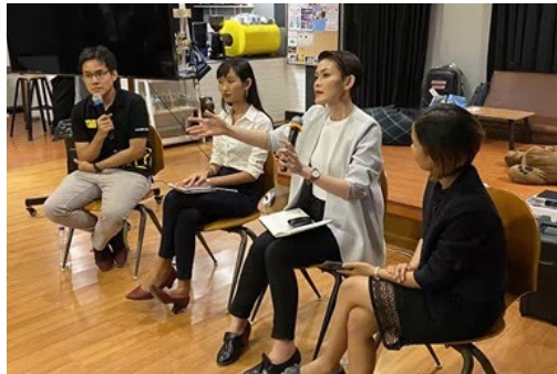
กลุ่มแอมเนสตี้จัดงานทางด้านการศึกษาเป็นประจำ เช่น การเสวนา-วิทยากรร่วมพูดคุย

กลุ่มนักเรียนเป็นพื้นที่ที่สำคัญสำหรับสมาชิกเยาวชนในการพัฒนาตนเองให้เป็นนักเคลื่อนไหวด้านสิทธิ มนุษยชน ผ่านงานที่พวกเขาทำ กลุ่มแอมเนสตี้ อินเตอร์เนชั่นแนล ได้แนะนำให้นักเรียนนับพันคนทั่วโลกได้รู้จักกับประเด็นสิทธิมนุษยชน ซึ่งอาจเป็นครั้งแรกในชีวิตของพวกเขาหลายคน คนที่ได้เรียนรู้เรื่องราวเหล่านี้ สมาชิกเยาวชนแบ่งปันข้อความแห่งความหวังของแอมเนสตี้ อินเตอร์เนชั่นแนล ที่ว่าเราไม่จำเป็นต้องรู้สึกเศร้าใจกับความทุกข์ทรมานต่างๆ ในโลก แต่เราสามารถออกมาทำบางสิ่งเพื่อสร้างการเปลี่ยนแปลง หรือแม้แต่ช่วยชีวิตคน ด้วยวิธีนี้ สมาชิกกลุ่มนักเรียนของแอมเนสตี้จึงมีส่วนช่วยในการเป็นผู้นำให้เยาวชนได้ออกแบบปัจจุบันและอนาคตของตนด้วยตัวเอง