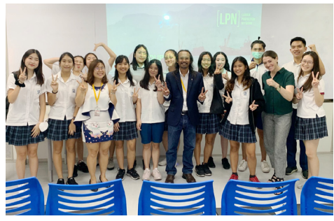
เจ้าหน้าที่ของแอมเนสตี้ ประเทศไทย ได้เชิญวิทยากรมาพูดให้กับกลุ่มนักเรียนที่โรงเรียนสิงคโปร์ อินเตอร์เนชั่นแนล

ในฐานะสมาชิกของแอมเนสตี้ อินเตอร์เนชั่นแนล คุณจะได้อธิบายกับสมาชิกท่านอื่น ๆ ที่มีความเชื่อและศรัทธาในสิ่งเดียวกัน “ร่วมกันคุณจะได้ประสบความสำเร็จได้มากกว่าเพียงคนเดียว” นอกเหนือจากการได้เรียนรู้เกี่ยวกับสิทธิมนุษยชน คุณจะได้เรียนรู้ทักษะที่สำคัญต่างๆ มากมาย เช่น วิธีการทำงานและแก้ปัญหาพร้อมกับผู้อื่น วิธีวางแผนกิจกรรมหรืองานใหญ่ๆ วิธีพูดถึงประเด็นที่สำคัญสำหรับคุณ วิธีใช้ความคิดสร้างสรรค์อย่างไรให้ได้รับความสนใจจากผู้อื่น วิธีจัดการกับเวลาและทรัพยากรที่มีวิธีการเผยแพร่กิจกรรมผ่านทางออนไลน์ ออฟไลน์ หรือตัวต่อตัว เป็นต้น มหาวิทยาลัยและนายจ้างมักมองหาผู้สมัครที่มีความสนใจในเรื่องที่มีความหมาย ผู้ที่ใช้เวลาไปกับการอาสาช่วยเหลือผู้อื่น และผู้ที่ได้พัฒนาทักษะเรื่องความรับผิดชอบและความเป็นผู้นำ ซึ่งแอมเนสตี้สามารถช่วยคุณพัฒนาในด้านเหล่านี้ได้