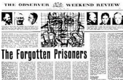
บทความที่มีอิทธิพลของเบนเนสันได้โน้มน้าวให้คนทั่วไปสร้างการเคลื่อนไหวโดยตรงต่อสิทธิมนุษยชน

ในปีพ.ศ. 2504 ปีเตอร์ เบนเนสัน ทนายความชาวอังกฤษ รู้สึกโมโหเมื่อรับรู้ว่ามีนักเรียนสองคนที่อาศัยอยู่ในประเทศโปรตุเกส ที่ในขณะนั้นอยู่ภายใต้การปกครองแบบระบอบฟาสซิสต์ ต้องถูกคุมขังหลังจากชนแก้วเพื่อเฉลิมฉลองให้กับอีสรภาพของพวกเขา เขาจึงเขียนบทความเพื่อตีพิมพ์ลงในหนังสือพิมพ์ออปเซอร์เวอร์ของลอนดอน และเรียกร้องให้ผู้อ่านเขียนจดหมายถึงรัฐบาลต่างๆ ทั่วโลก ให้ปล่อยตัวเหล่านักโทษทางความคิด บทความของเขาได้ถูกแปลและตีพิมพ์ในหนังสือพิมพ์อีกหลายฉบับทั่วโลก “คำร้องทุกข์เพื่อการนิรโทษกรรม” นี้ได้รับการตอบรับอย่างล้นหลาม จากความสำเร็จนี้ เครือข่ายนักเคลื่อนไหวได้ตัดสินใจเขียนจดหมายเพื่อช่วยเหลือบุคคลอื่นๆ ที่ถูกกักขังอย่างไม่เป็นธรรม และแอมเนสตี้ อินเตอร์เนชั่นแนลก็ได้ถือกำเนิดขึ้น