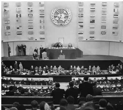
ประเทศไทยเป็นหนึ่งใน 48 ประเทศแรกที่ลงมติเพื่อสนับสนุนปฏิญญาสากลว่าด้วยสิทธิมนุษยชน

ไม่ได้มีเพียงแค่นักเคลื่อนไหวที่ออกมาต่อต้านกลุ่มเผด็จการเหล่านี้ แต่รัฐบาลฝ่ายพันธมิตรก็ใช้สิทธิมนุษยชนเป็นเครื่องมือในการปลุกเร้าเพื่อระดมพลประชาชนให้ออกมาต่อสู้เช่นเดียวกัน สงครามครั้งนี้ยังเป็นตัวกระตุ้นให้เกิดการเคลื่อนไหวทางสังคมเพื่อต่อต้านการล่าอาณานิคมและการเลือกปฏิบัติทางเชื้อชาติในดินแดนที่อยู่ภายใต้อำนาจของกลุ่มพันธมิตร ในขณะที่หนึ่งส่วนสามของโลกได้อยู่ภายใต้การปกครองของประเทศเจ้าอาณานิคม (750 ล้านคนในเอเชียและแอฟริกา) การเคลื่อนไหวเพื่อสิทธิในการเลือกรูปแบบการปกครองของตนเองและเพื่อความเสมอภาคเหล่านี้ ได้มีการใช้สิทธิมนุษยชนเพื่อช่วยเน้นให้เห็นถึงความจำเป็นของกลุ่มพันธมิตร และเพื่อตรวจสอบความสมเหตุสมผลของสิ่งที่กลุ่มพันธมิตรกำลังทำ และสร้างความเป็นน้ำหนึ่งใจเดียวกัน