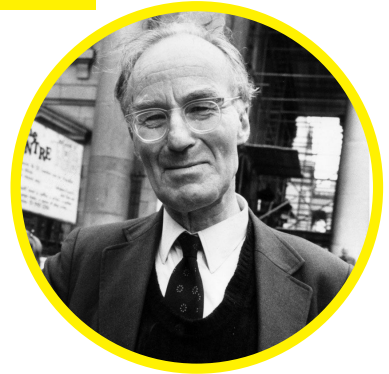
AI founder Peter Benenson

แอมเนสตี้ อินเตอร์เนชั่นแนล เป็นขบวนการเคลื่อนไหวระดับโลกของคนกว่าแปดล้านคนทั่วโลกที่นำความยุติธรรมมาเป็นแรงผลักดัน เราลงแรงเพื่อหวังจะเห็นโลกที่มนุษย์ทุกคนมีสิทธิมนุษยชนอย่างเสมอภาค วิทยาลัยนี้ได้ถูกปกป้องไว้ในปรัชญาของศาสนาว่าด้วยสิทธิมนุษยชนตั้งแต่ปี พ.ศ. 2491 และมาตรฐานทางด้านสิทธิมนุษยชนอื่นๆ ที่ได้รับการยอมรับในระดับสากล เราทำงานเพื่อปกป้องผู้ที่ไม่ได้รับความยุติธรรม อีสรภาพ ความจริง และศักดิ์ศรี แอมเนสตี้ อินเตอร์เนชั่นแนล ดำเนินการโดยได้รับทุนสนับสนุนจากสมาชิกเราเป็นอิสระจากอุดมการณ์ทางการเมือง ผลประโยชน์ทางเศรษฐกิจ หรือศาสนา