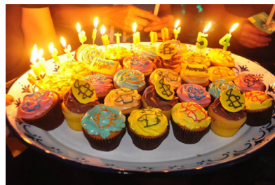
งานวันเกิดครบรอบ 57 ปีแอมเนสตี้ อินเตอร์เนชั่นแนล จัดขึ้นที่สำนักงาน แอมเนสตี้ อินเตอร์เนชั่นแนล ประเทศไทย