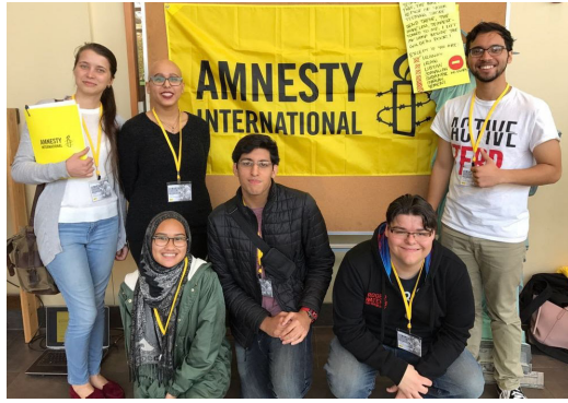
ชุมชนแอมเนสตี้ ปีตตามได้จัดกิจกรรมกับกลุ่มนักศึกษามหาวิทยาลัยสงขลานครินทร์ วิทยาเขตปีตตาม เพื่อสำรวจชี้แนะเขียนจดหมายให้กำลังใจนักปกป้องสิทธิที่ถูกละเมิดในประเทศไทย

กลุ่มนักเรียนของแอมเนสตี้เกิดจากการรวมตัวของสมาชิกเยาวชน ที่มาพบปะกันเป็นประจำเพื่อจัดกิจกรรมในการส่งเสริมสิทธิมนุษยชนศึกษา และการรณรงค์ในโรงเรียนของพวกเขา พวกเขาเลือกที่จะทำงานในประเด็นสิทธิมนุษยชนที่หลากหลาย รวมถึงประเด็นสำคัญ ที่องค์กรใหญ่ให้ความสำคัญ กลุ่มนักเรียนของแอมเนสตี้สามารถตัดสินใจร่วมกันว่าต้องการจัดกิจกรรมแบบไหนเพื่อที่จะสามารถเข้าถึงเพื่อนนักเรียนร่วมชั้นคนอื่น ๆ ได้อย่างมีประสิทธิภาพมากที่สุด ซึ่งอาจรวมถึงการเขียนจดหมายในรูปแบบของการช่วยเหลือคนที่มีความเสี่ยง โดยการจัดกิจกรรมที่โรงเรียนของพวกเขา